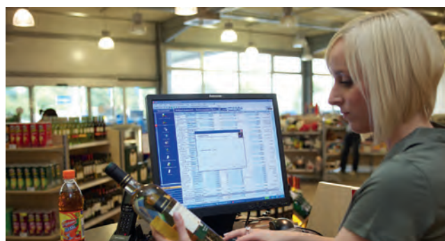
Die zuverlässige Tankstellen-Kasse von Huth.