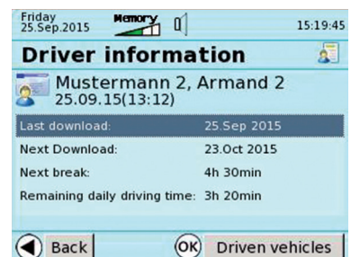
TFT-Farbdisplay mit graphischen Symbolen