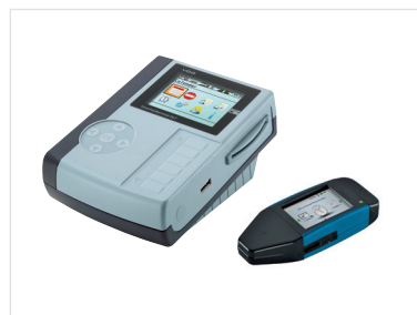
Heruntergeladen von Fahrerkartendaten und Massenspeicherdaten