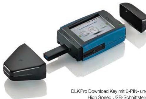
DLK Pro Download Key mit 6-PIN- und High Speed USB-Schnittstelle

Bestell-Nr. DLK Pro Download Key: A2C59514502 Bestell-Nr. DLK Pro Licence Card: A2C59514674 Bestell-Nr. DLK Pro Power Box: A2C59514675 Bestell-Nr. DLK Pro Neoprene Case: A2C59514917